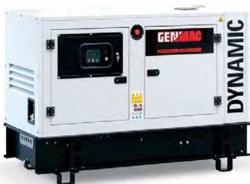
Изображение только для иллюстрации