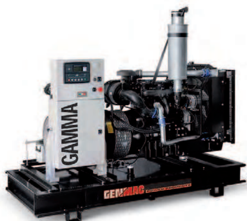
Изображение только для иллюстрации